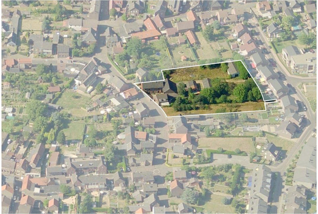
Een oudere foto van het plangebied vanuit de lucht