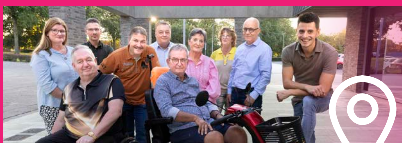
Adviesraad Sociaal Domein

Van 9 tot en met 15 september is het Wereld Suicide Preventie Week. Mensen dragen in die week een geel lintje om steun te tonen en het gesprek over geestelijke gezondheid aan te gaan. Het doel van de week? Het doorbreken van isolatie en eenzaamheid! Bezoek de stand van de Adviesraad Sociaal Domein op de weekmarkt in Stein, woensdag 11 september van 13.00-17.00 uur. Ontvang een geel lintje, doe mee aan onze quiz en ontdek hoe je kan bijdragen aan suicide preventie. Wees een lichtpuntje en maak verschil! Wil je in contact komen met de adviesraad? Ga dan naar www.gemeentestein.nl/adviesraad-sociaal-domein .