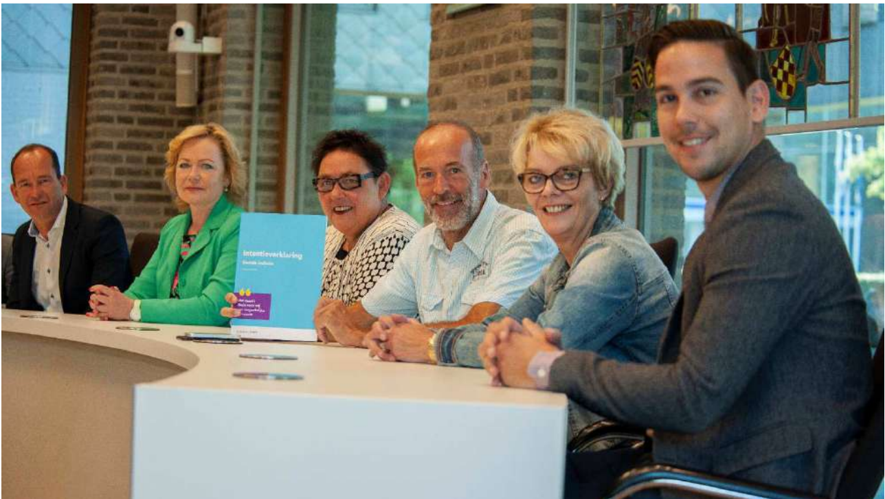
18 september 2018: het college van burgemeester en wethouders ondertekent de intentieverklaring.

De Klankbordgroep Inclusie in Stein speelt dus een belangrijke rol in het bevorderen van inclusie en zet zich in voor een gemeente waar iedereen kan meedoen en meetelt.