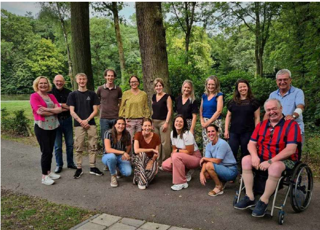
Eén van de 'meedenkgroepen'

Conform de vorige Inclusie Agenda wordt per thema eerst benoemd welke acties al uitgevoerd zijn, gevolgd door de nieuwe ambities/ideeën.