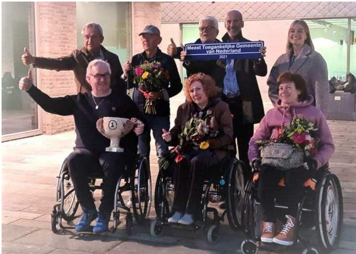
Op 7 oktober 2021 won de gemeente Stein de titel: Meest toegankelijke gemeente van Nederland

Twee jaar later tekende het college van burgemeester en wethouders van de gemeente Stein de intentieverklaring om van Stein een inclusieve gemeente te maken. En met succes: in 2021 werd de gemeente Stein uitgeroepen tot de meest toegankelijke gemeente van Nederland!